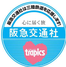
協賛ヘッドマーク

今回のツアーでは旅行代金よりおひとり様2,000円を三陸鉄道へ寄付し、今後も旅行を通じて東北の復興を支援してまいります。